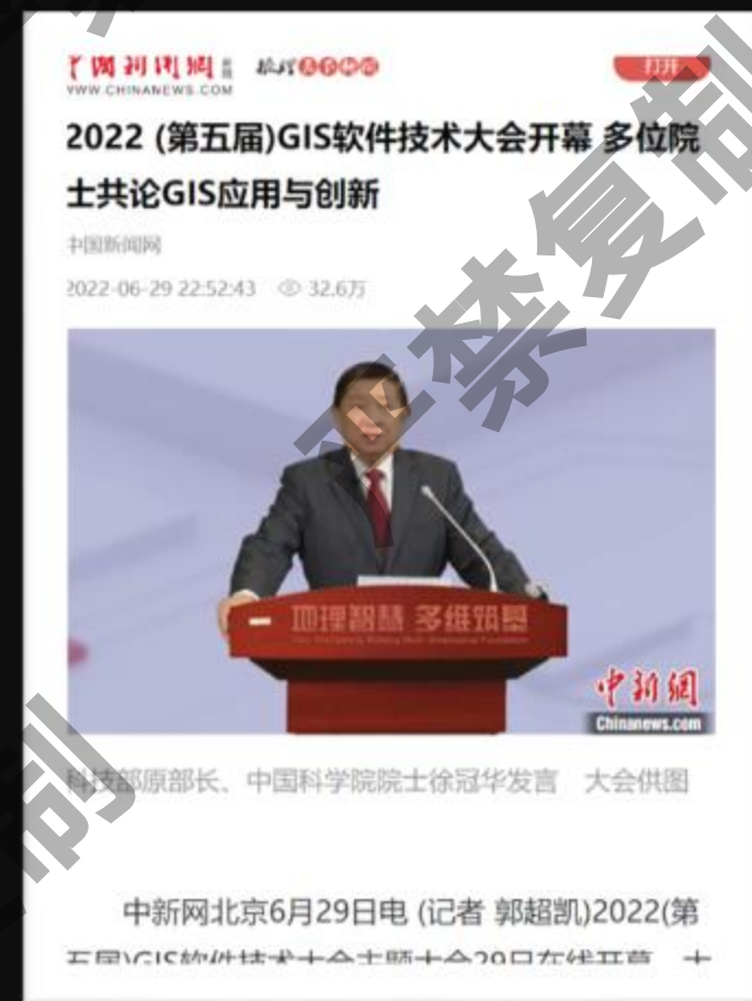
中国新闻网报道, 32.6万 阅读量