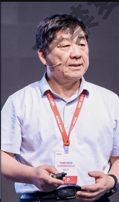
陈军 中国工程院院士