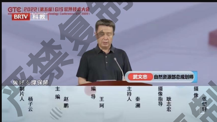
BTV科教频道《创新北京》栏目播出