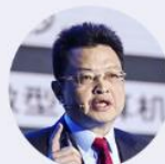
李建成 中国工程院院士