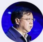
王广华 自然资源部部长(时任副部长)