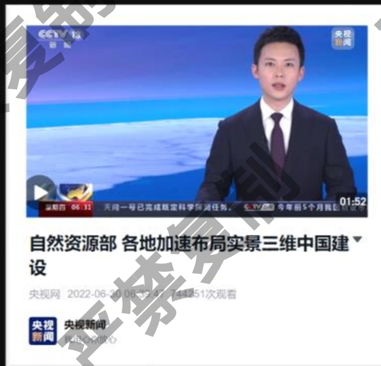
央视新闻报道, 74万+ 次观看量