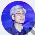
郭仁忠 中国工程院院士、深圳大学 智慧城市研究院院长