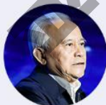
王钦敏 十二届全国政协副主席、国家 电子政务专家委员会主任