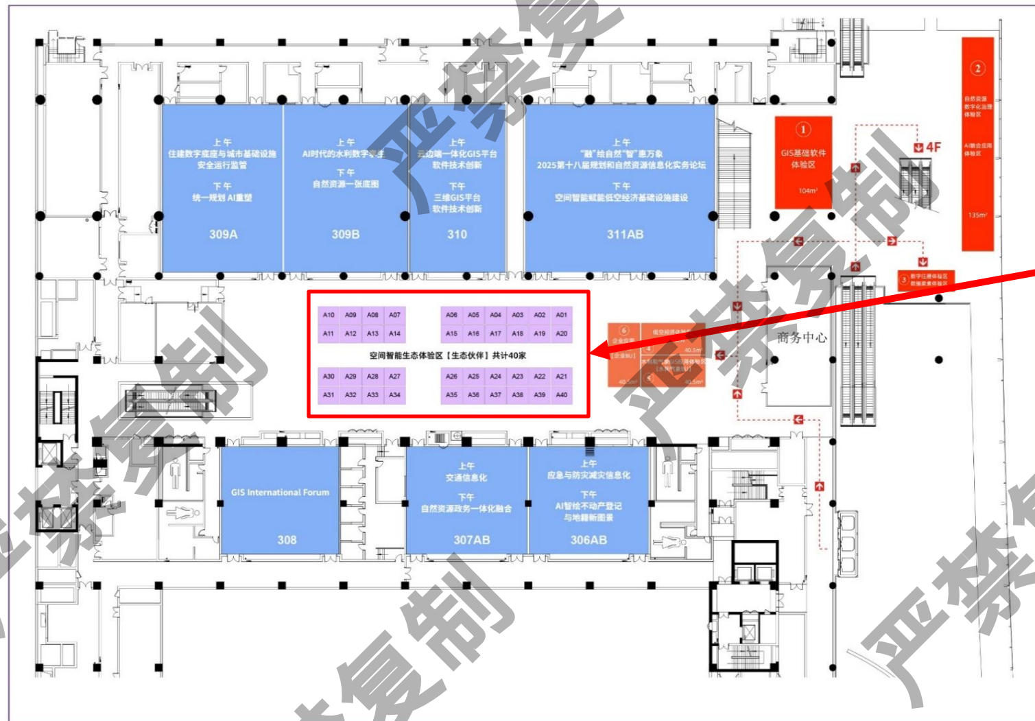
2025空间智能软件技术大会三层平面图