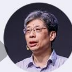
蔡阳 水利部信息中心原主任、中国 地理信息产业协会副会长