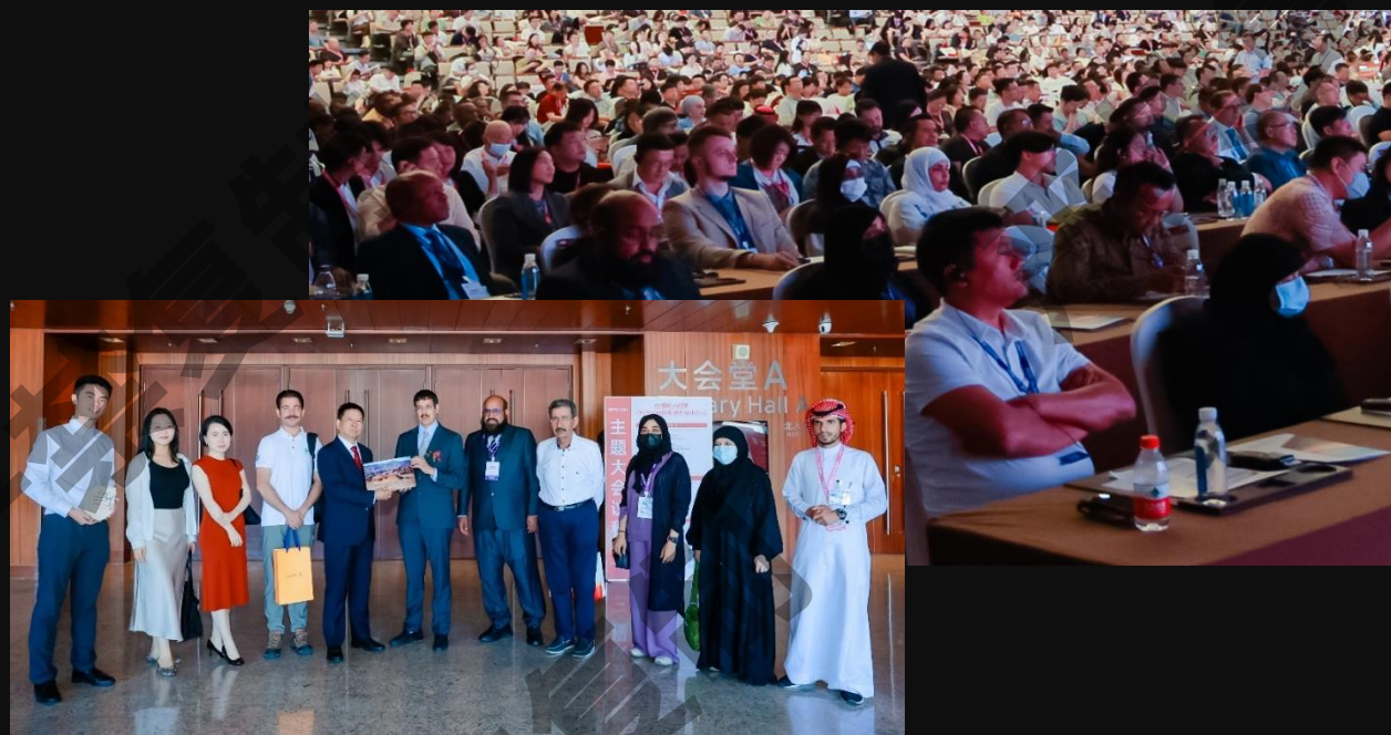
外宾赠送超图礼物

部分来访嘉宾所属国：乌兹别克斯坦，马来西亚，韩国，泰国，菲律宾，肯尼亚，塞尔维亚，英国，阿尔及利亚，印度尼西亚，沙特阿拉伯，俄罗斯，墨西哥，南苏丹，伊拉克，卢旺达，阿富汗，埃塞俄比亚，博茨瓦纳，柬埔寨，纳米比亚，塞拉利昂，叙利亚，巴基斯坦，伊朗，秘鲁，约旦，尼日利亚，所罗门群岛