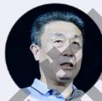
武文忠 自然资源部总规划师