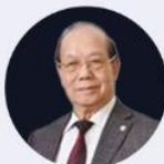
童庆禧 中国科学院院士