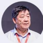
陈军 中国工程院院士、自然资源部 实景三维中国建设专家组组长