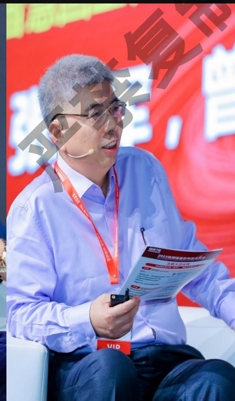
李满春 国际欧亚学院院士 南京大学教授