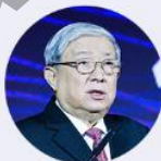
徐冠华 科学技术部原部长 中国科学院院士