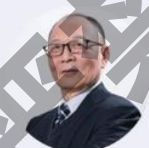
李德毅 中国工程院院士