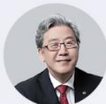
吴志强 中国工程院院士 德国工程科学院院士 瑞典皇家工程科学院院士