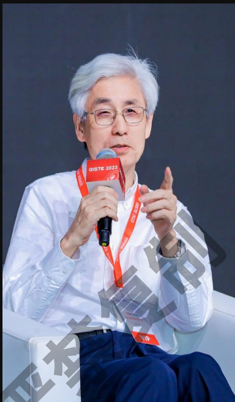
郭仁忠 中国工程院院士 深圳大学智慧城市研究院院长