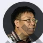
周成虎 中国科学院院士