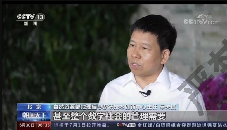
CCTV13新闻频道《朝闻天下》栏目播出